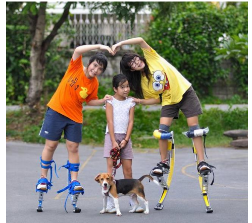
สามสาววันนี้ กับเบอร์ดีห์มาน้อย

ผมว่า ผมบรรลวิตุประสงค์ ที่อยากให้พวกเด็กได้มีโลกทัศน์ที่กว้างขึ้น ได้เห็นความสำคัญและกระตุ้นแรงบันดาลใจให้เห็นความสำคัญของภาษาอังกฤษ ขณะเดียวกัน ก็มีความสุขสนุกสนานกับการได้ท่องเที่ยวโลกกว้างไปด้วย ทั้งหมดนี้ต้องขอขอบคุณ ‘น้ำต๋ม’ ที่ดูแลทุกเรื่องเป็นอย่างดี ขอสารภาพว่าตอนก่อนส่งคนแรกไป ก็ยังรู้สึกเกร็งๆ หน่อยๆ แต่พอหลังจากนั้น ไม่ลังเลเลยแม้แต่หน่อย ที่จะทยอยส่งน้องๆตามรอยพี่สาวไปกับคุณต๋มอีก (นี่ถ้าผมมีคนทีี่สั่นที่ห้า ก็คงส่งไปอีกจริงๆนะ) ขอขอบคุณ Smart New Zealand Education ครับ การได้ไป New Zealand นั้นถือเป็น Mile stone ที่สำคัญในช่วงชีวิตของพวกเขาเค้าเลยก้อว่าได้.”