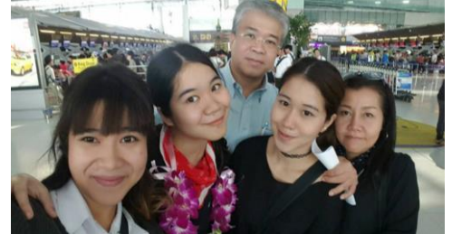
สามสาววันนี้ (ภาพสองปีแล้ว) น้องเล็กเป็นตัวแทนประเทศไทย ไปสัมมนาที่เม็กซิโก

ข้อความจาก “น้องพลู” นักเรียนที่ไปสองปีซ้อน 2015 & 2017 นักเรียนโรงเรียนกรุงเทพคริสเตียน “พลู” อายุ 12 เมื่อไปทริปครั้งแรก และ 14 เมื่อไปทริปครั้งที่สองกับ SNZ