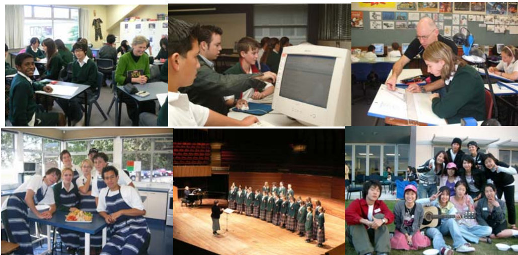
ภาพถ่ายจากสถานที่จริง – LINCOLN HIGH SCHOOL, CHRISTCHURCH