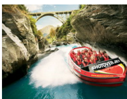
ซิ่งเจ็ทโบ๊ต