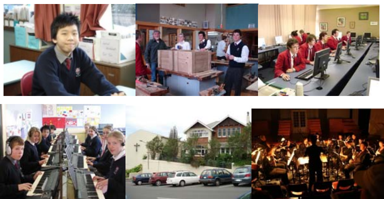
ภาพถ่ายจากสถานที่จริง – KAVANAGH COLLEGE, DUNEDIN