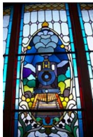
Train Trip และสถานีรถไฟ