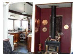
ตัวอย่างบ้านโฮมสเตย์

ที่บ้านโฮมสเตย์خانเมืองไครส์เชิร์ช ไครส์เชิร์ช - 2008