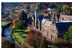
มหาวิทยาลัยโอทาโก้

จุดพักผ่อนโปรแกรมนำเที่ยวในอีก 5 เมืองเด่นของนิวซีแลนด์ Wanaka, Queenstown, Cromwell, Tekapo และ Auckland