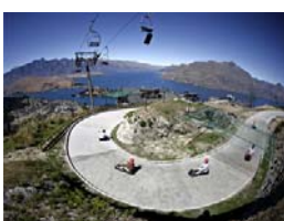
เล่นลูลงจากเขา