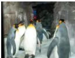
โลกใต้ทะเล/ชมชีวิตเพนกวิน