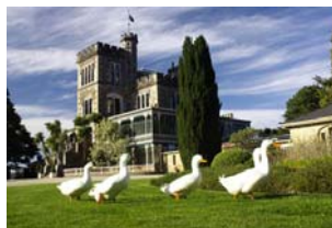
ปราสาทลาร์นัค