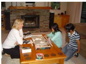
โฮสต์มีม-ลินดี สเลเดอร์

กำลังเล่น 3D Scrabble กับนักเรียน นอร์ธชอร์ชด์ อ็อคแลนด์ - 2007