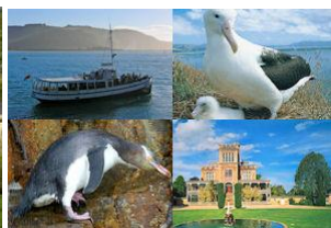
ล่องเรือ/ดูนกเพนกวิน/สิงโตทะเล