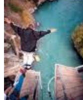
ลูนโดคบันจี้จัมพ์