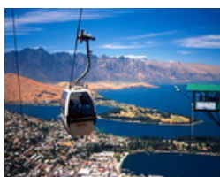
ขึ้นกระเช้ากอนโดลา