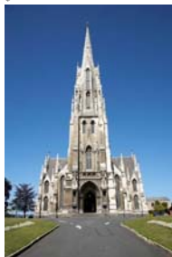
เฟิร์สเชิร์ช