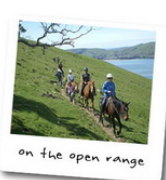
ขี่ม้าชมวิว