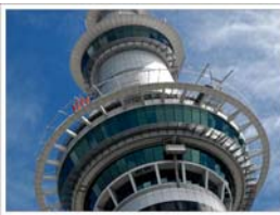
ขึ้นสกายทาวเวอร์