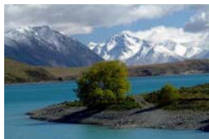
เซ็ทลันซ์อาหารญี่ปุ่นริมทะเลสาบ