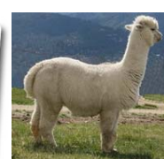
เที่ยวฟาร์มอัลปาก่า